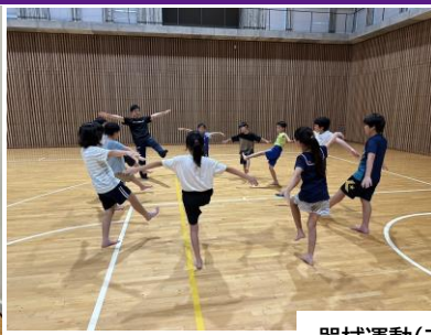
器械運動(マット運動)